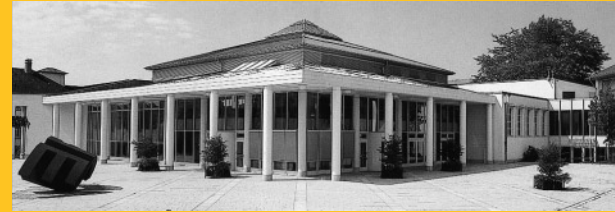
Bürgerhaus Neuer Markt, Bühl Ecke Eisenbahnstr./Hindenburgstr.

Zu ihrer Verfügung stehen: Bücher, Informationsstände und GfA-Dokumentationen